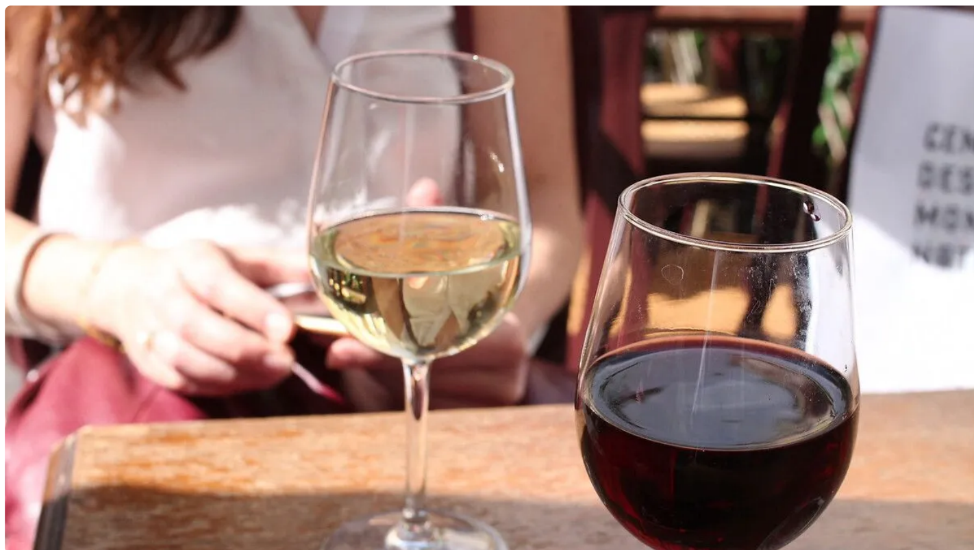
Un verre de rouge et un verre de vin blanc en terrasse (photo d'illustration).

Dry January est l'occasion d'ouvrir le débat sur l'alcoolisme. Un film sur le sujet est diffusé ce mardi 21 janvier au cinéma CGR de Châteauroux.